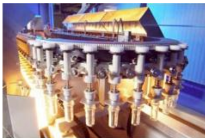
Система перемещения преформ