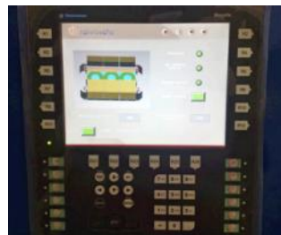
touch-screen панель Schneider