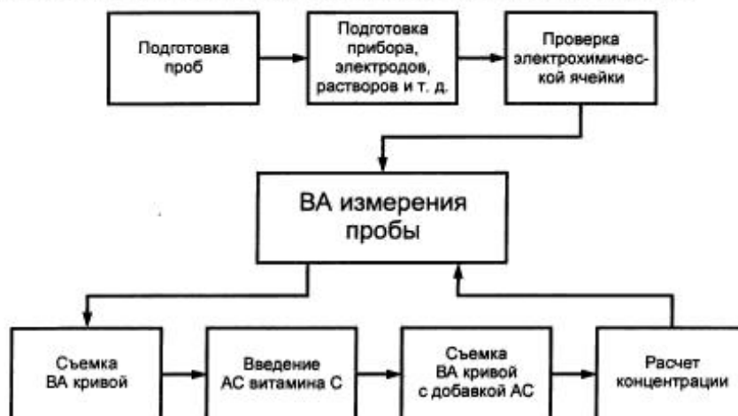
Рисунок 1 — Основные этапы анализа проб ВА методом

ВА метод анализа проб пищевых продуктов с целью определения массовой концентрации витамина С (аскорбиновой кислоты) состоит в проведении вольтамперметрических измерений раствора пробы после ее предварительной подготовки. Общая схема анализа представлена на рисунке 1.